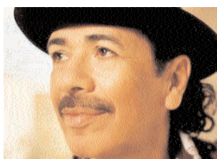
Carlos Santana - Lebensfreude und Latin-Rock (auf Tournee in Deutschland: 05.05.-28.05.2006)

Nach ihrem fulminanten Debüt „Call Off The Search“ hat sich um die gebürtige Georgierin Katie Melua eine gewaltige Fangemeinde etabliert. Jetzt geht Katie Melua erneut live auf Tournee. Ihre natürliche Ausstrahlung, ihr außergewöhnliches Talent, die einmalige Bühnenpräsenz und eine herausragende Band machen die Konzerte zu unvergesslichen Erlebnissen.