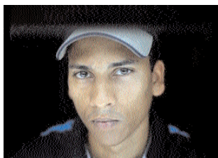
Xavier Naidoo - Mannheims populärster Sohn (auf Tournee in Deutschland: 17.02.-03.04.2006)

Der Frühling lässt noch auf sich warten. Kein Problem: Diese Künstler heizen ihren Fans so richtig ein. Karten gibt es unter www.eventim.de und www.getgo.de