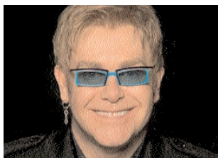
Elton John - auf der Bühne zu Hause (auf Tournee in Deutschland: 31.05.-08.06.2006)

Mit übernatürlichen Kräften oder schwarzer Magie hat der Erfolg von Carlos Santana wahrlich nichts zu tun, trotz Megahits wie „Black Magic Woman“ oder „Supernatural“. Über 30 Jahre erstreckt sich die Karriere des aus Mexiko stammenden Ausnahmekünstlers, der Latin-Rock und Lebensfreude aus seiner Gitarre zaubert. Alles was er kann, zeigt der charismatische Gitarrist den deutschen Fans auf seinem aktuellen Album „All That I Am“ und bei seiner Europatournee im Mai 2006.